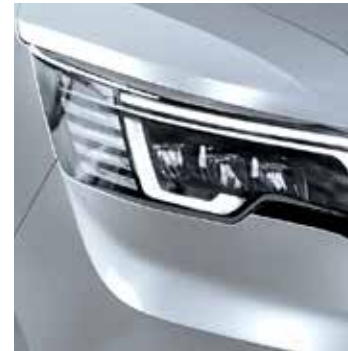
HIGHLAND GRAU GRIS