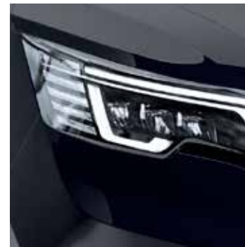
JET SCHWARZ NOIR