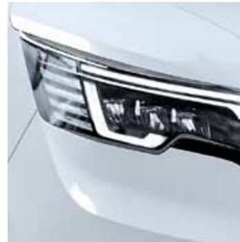
GLACIER WEISS BLANC