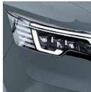
URBAN GRAU GRIS