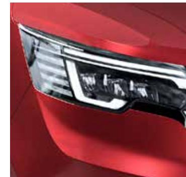
CARMIN ROT ROUGE