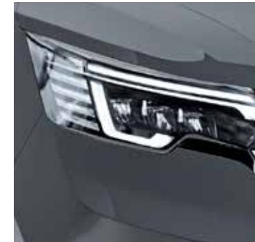
COMETE GRAU GRIS